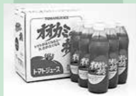
特産品 「オオカミの桃」