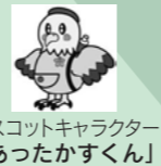
マスコットキャラクター 「あったかすくん」