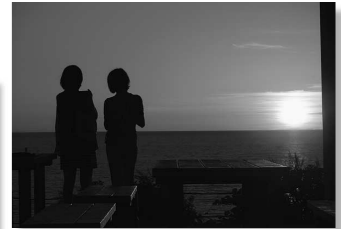
優秀賞 「大人の夏休み」