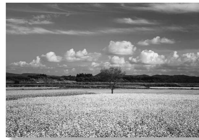
審査員特別賞 「そば畑快晴」