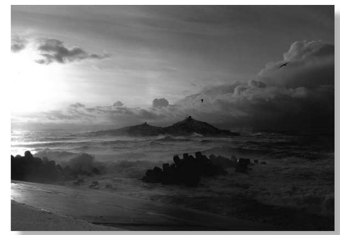
最優秀賞 「荒れる海」