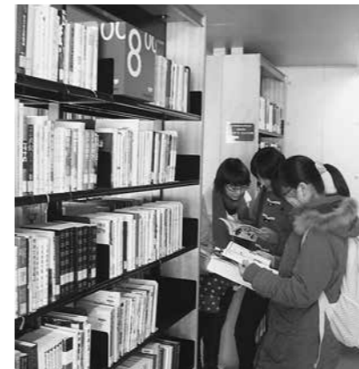
国際教養大学の図書館を見学

1月20日、八峰町図書室主催の選書ツアーが行われ、小学生から70代の方まで、13名が参加しました。 午前中は国際教養大学のキャンパス・図書館を見学。近代的な建物に参加者は見入っていました。大学のカフェテリアで昼食をとった後は、加賀谷書店で図書室に置く本を全員で選びました。どんな本を皆さんが読みたいのか、たいへん参考になりました。 選んでもらった本は、ファガス・峰栄館図書室で貸出しています。是非ご利用ください。