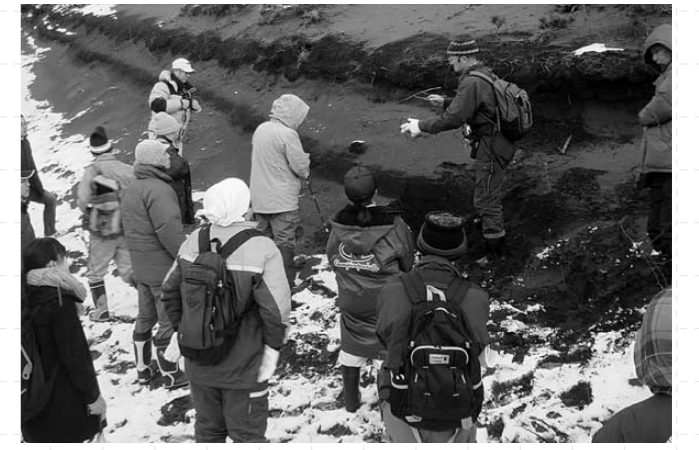
写真2 2枚の腐植土の様子