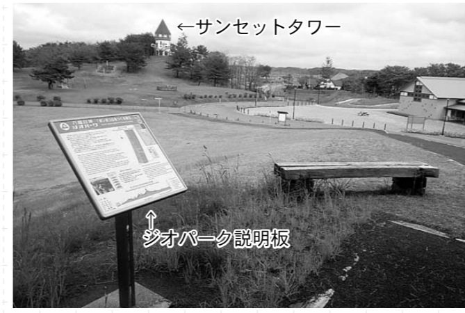
写真1 砂丘の頂上に立つサンセットタワー