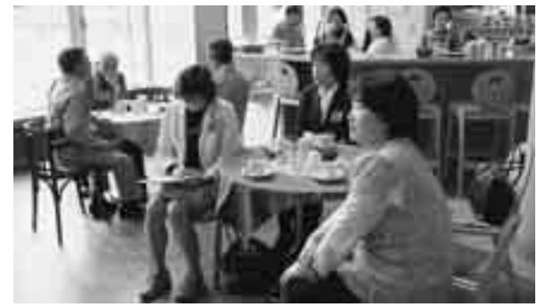
藤里町文流サロン「よってたもれ」の視察研修