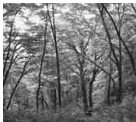
壮大なブナの原生林

また、この日は八峰白神ガイドの会によるガイド講習会も同時に開催され、危険な箇所や改善が必要とされる部分について確認しながら、本番で予定しているコースを歩きました。当日は参加者の皆様に喜んでいただき、安全に実施できるように万全の態勢で臨みたいと思います。なお、受講された皆さんからは当日のガイドをしていただくことになっております。