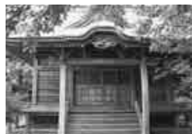
町有形文化財「旧山神社」

このあと、今年度の歴史講演会や文化祭での別海町「加賀家のパネル展示」などについて説明を受け、話し合いがもたれました。会議終了後、平成15年8月に旧八森町で有形文化財に指定し、鉾山の神を祭る神社として明治41年に建立された「旧山神社」などを視察しました。(注:「旧山神社」としたのは、平成13年度に八森滝上にある発盛鉱業所「山神社」のご社体を白瀑神社に遷座したことによる。)