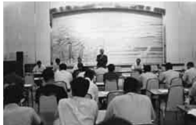
真剣に耳を傾ける参加者

7月17日、八峰町スポ少化説明会・推進委員会が峰栄館で開催され、町内小学校教諭や保護者等スポ少関係者52名が参加しました。