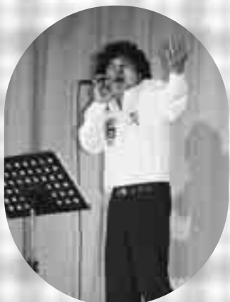
熱唱を披露したカラオケ