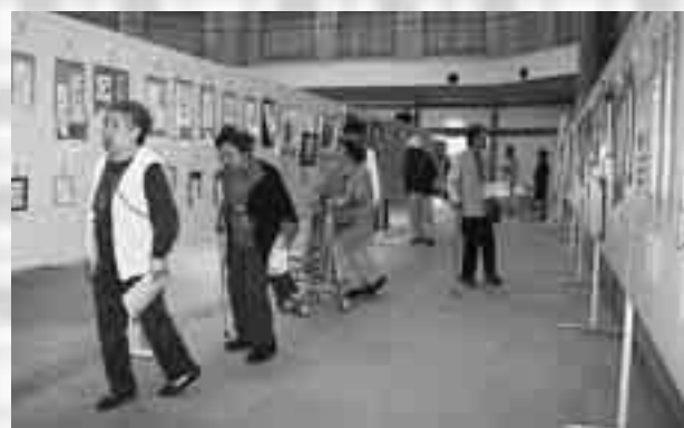
ファガスでもたくさんの力作が展示されました