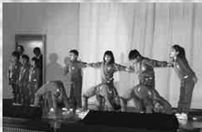
「とび出せちゃれんじキッズ」水沢小2年生

第2回八峰町文化祭が、11月10日から13日までの日程で、峰栄館やファガス、峰浜中学校、峰浜土床体育館を会場に開催されました。作品展示は、峰栄館とファガスで行われ、書道や絵画、俳句、生け花、陶芸や手芸などのほか、小学生のイラストなど1,814作品が展示されました。訪れた人は素晴らしい力作に足を止めて見入っていました。また、峰栄館では茶道クラブによる茶席が催され、着物姿の小学生が来館者にお点前（おてまえ）を披露していました。