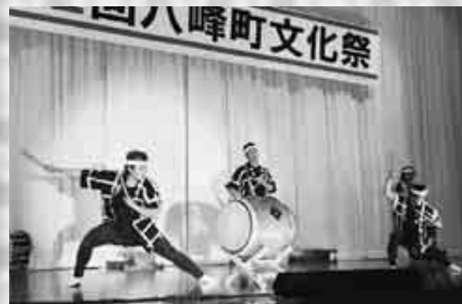
オープニングを飾った祭鼓連の演奏

団体約190人が日頃練習した成果を披露しました。第1部は祭鼓連の力強い太鼓演奏にはじまり、小学生児童による踊りや合唱、ハーモニカの演奏など、会場はたくさんの拍手に包まれていました。第2部では、大正琴や踊り、尺八演奏など、芸術文化協会の会員の皆さんが、日頃の練習の成果を存分に発表しました。最後は勇壮な石川の駒踊りが登場し、所狭しと跳ね回る駒の姿に観客から惜しみない拍手が送られました。また、第3部では八森ミュージッククラブなどのバンドライブが行われ、熱い演奏に盛り上がりました。