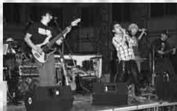
熱いステージを繰り広げたバンドライブ！