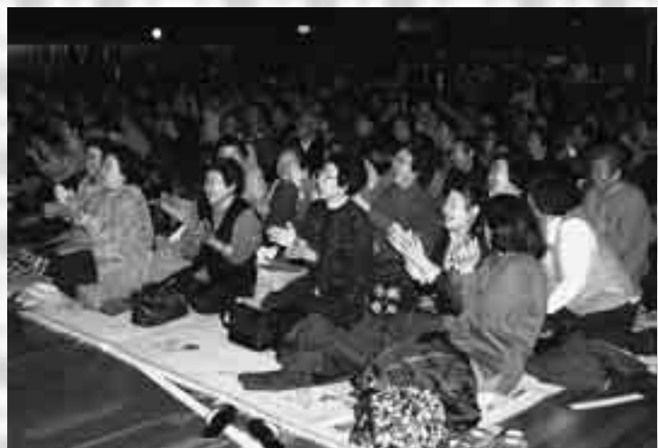
多彩な発表に会場は大盛況！

第2回八峰町文化祭が、11月10日から13日までの日程で、峰栄館やファガス、峰浜中学校、峰浜土床体育館を会場に開催されました。作品展示は、峰栄館とファガスで行われ、書道や絵画、俳句、生け花、陶芸や手芸などのほか、小学生のイラストなど1,814作品が展示されました。訪れた人は素晴らしい力作に足を止めて見入っていました。また、峰栄館では茶道クラブによる茶席が催され、着物姿の小学生が来館者にお点前（おてまえ）を披露していました。