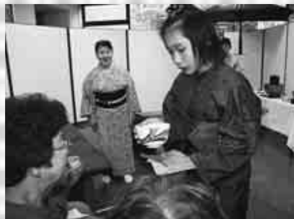
峰栄館の茶席でお点前を披露