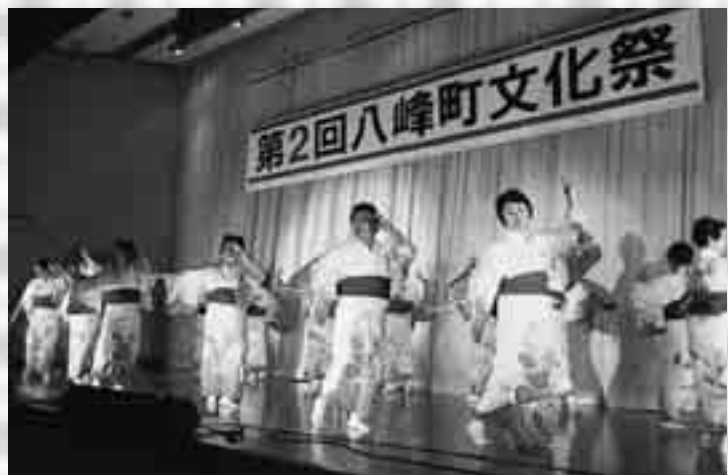
各団体が華やかな踊りを披露！