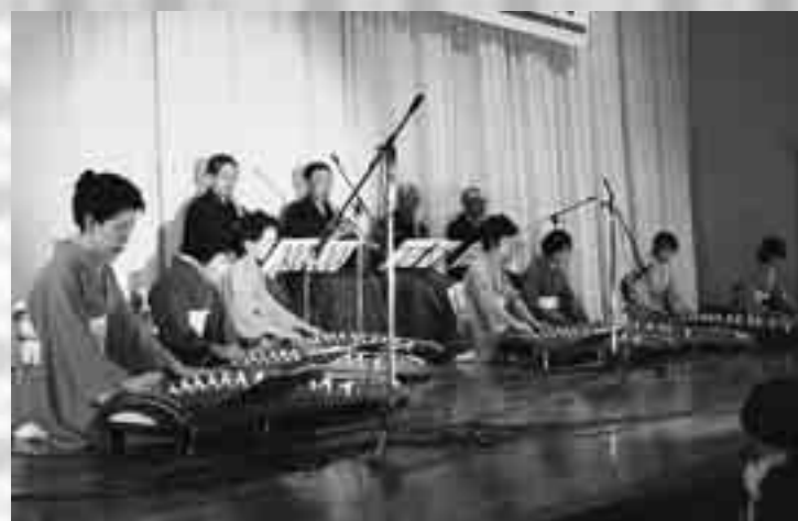
大正琴と尺八の共演！