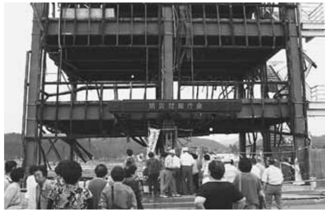
南三陸町の防災対策庁舎を視察しました

ことぶき大学の移動研修が、7月12日から1泊2日で行われ、52人の大学生が参加しました。 今年は山形県金山町や宮城県南三陸町を巡る研修で、1日目は「蔵と水路のまち」として知られる金山町を散策。その後、鳴子温泉で旅の疲れを癒しました。2日目は、宮城県南三陸町で東日本大震災の被災地を視察しました。被災した志津川病院や合同庁舎を車窓から眺めたほか、骨組みだけとなった防災対策庁舎に立ち寄り、津波の悲劇を思い起こしながら犠牲者の冥福を祈りました。