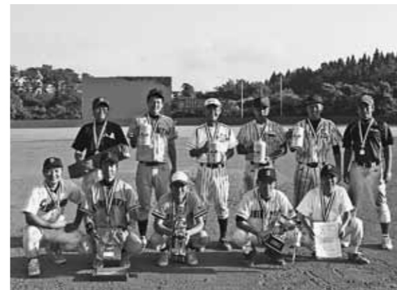
優勝したデルタ八森チーム

第7回八峰町民野球大会が7月24日と31日の2日間にわたり、峰浜野球場ほか4会場にて開催されました。八森地区9チーム、峰浜地区13チームの計22チームが参加して熱い戦いが繰り広げられました。 大会両日とも猛暑に見舞われましたが、随所に好プレーが見られ、選手たちの若さあふれるプレーに大きな声援が送られました。試合中は相手チーム