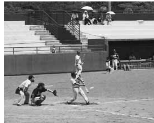
各会場で熱戦が繰り広げられました