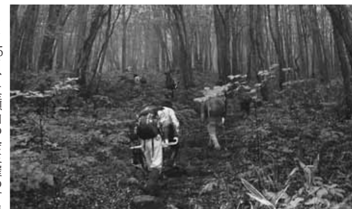
幻想的なブナ林を登りました

7月15日、真瀬山の会主催の町民登山が開催されました。この日は朝から雨模様で、空を仰ぎながらの出発となりました。登山口となる赤倉神社に着く頃には雨も上がり、期待の高まる出発となりました。このコースには三十三番観音が一番から祀られており、信仰の山であることが感じられるコースです。 予定を一部変更したものの、みずみずしく幻想的なブナ林と、石仏の優しい表情に励まされ、心身ともにリフレッシュした1日となりました。