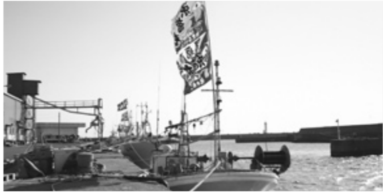
たくさんの大漁旗がはためきました

毎年恒例の行事、船霊（ふなだま）祭りが2月10日、八森岩館両漁港で行われ、関係者が神事に挑んだほか、両漁港ではたくさんの大漁旗が色鮮やかにたためきました。 秋田県漁業協同組合北部総括支所で行われた祈願祭では、船主や乗組員らが出席。神前に玉ぐしを奉納して海の恵みに感謝するとともに、今年も豊漁、無事故であるように祈りました。