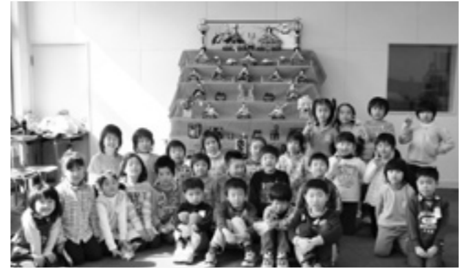
ひな壇の前で仲良く記念撮影

2月27日、観海小学校で子ども園児と小学生の交流として、少し早い、ひな祭り会が開催されました。 これは4月に新1年生になる観海子ども園の年長さんが、安心して入学を迎えられるようにと実施されたものです。 1年前まで、同じ子ども園の仲間同士ということもあって、読み聞かせやゲーム、おやつタイムなどの催しで、大変盛り上がりしていました。最後はおひな様の前で、みんな仲良く写真を撮りました。 4月の入学式が楽しみですね。