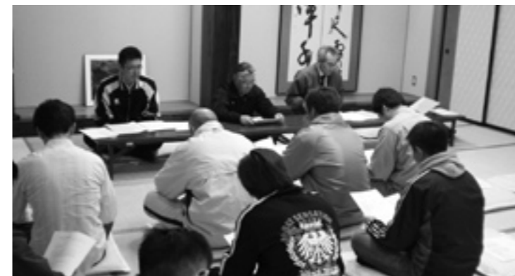
たくさんの方が参加しました

4月22日、峰栄館で能代市山本郡生涯学習奨励員地区連絡協議会が開催され郡市協議会の表彰者の選考や総会提出の議案審議が行われました。生涯学習奨励員は地域における生涯学習を盛んにするために、住民の身近なところで、それぞれの特技を通して学習活動を奨励・援助している方々です。町内では18名の方が活動している。文化祭などの町の行事にボランティアで参加するほか、自らも様々な研修会で勉強をしながら、生涯学習を周囲の住民に呼びかける活動をしています。 この日は、各市町の理事ら15名が参加し、昨年の活動内容や21年度の事業計画が話し合われました。