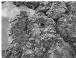
写真3 泊海岸でみられる枕状溶岩

写真4右上のところの丸い穴のあいだ溶岩の破片が凝灰岩の中にあっただ。この穴は溶岩が冷えて固まる前に気体（おそらく水蒸気）の泡が出来ていたものだろうと考えられています。