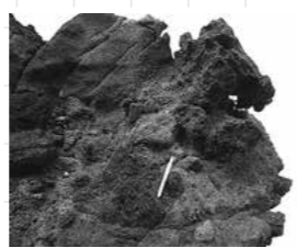
写真4 丸い穴がある溶岩（泊海岸）

泊海岸を観察していると、大昔に起こった海底火山の様子をあれこれと考えます。もし、その当時の情景を映画に撮られていたとすると、一体どんな情景が映し出されているだろうか？地震が起こり、噴火した溶岩は海底を流れ、バリバリと溶岩にひびがはいり、海は煮えたがり、火山灰は海水に混じり海は濁り、魚は死ぬ・・・。 もっと詳しく知りたいと思う人は是非泊海岸においてください。そして海岸を散歩しながら岩の様子を観察し、新しい物語をつくってみませんか。