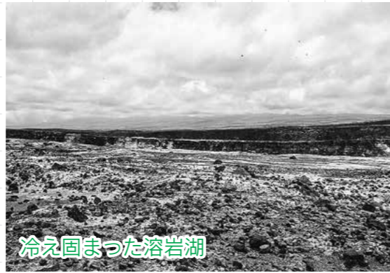
写真1 ハワイ島キラウエア火山 撮影2000年5月26日

キラウエア山の火山に驚く キラウエア火山は太平洋にできたハワイ諸島の一つで、山頂は標高1247mで、白神岳とほぼ同じ高さの火山です。写真1は山頂にできたカルデラの様子を撮ったものですが、この風景が八峰白神ジオパークエリア21「魚岩」の海岸（写真2）ととても良く似ていて、それに驚かされました。 どちらも火山灰に溶岩や溶岩の破片が混じってできた凝灰角礫岩から成り立っています。溶岩は火山灰より硬いので溶岩がボコボコと目立っています。