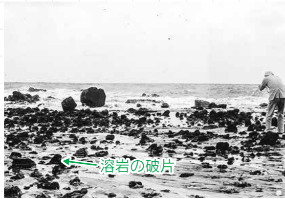
写真2 八峰町 泊海岸