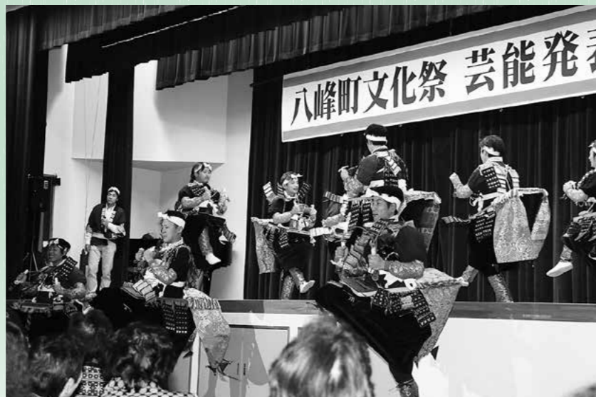
↑今年も大トリを飾った石川駒踊りで観客の興奮は最高潮に！