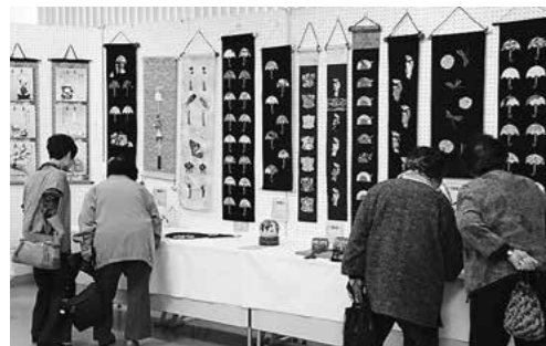
↑展示作品の出来映えに感心していました