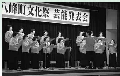
↑「麦の唄」「花燃ゆメインテーマ」などを歌いあげたコーラスうらら