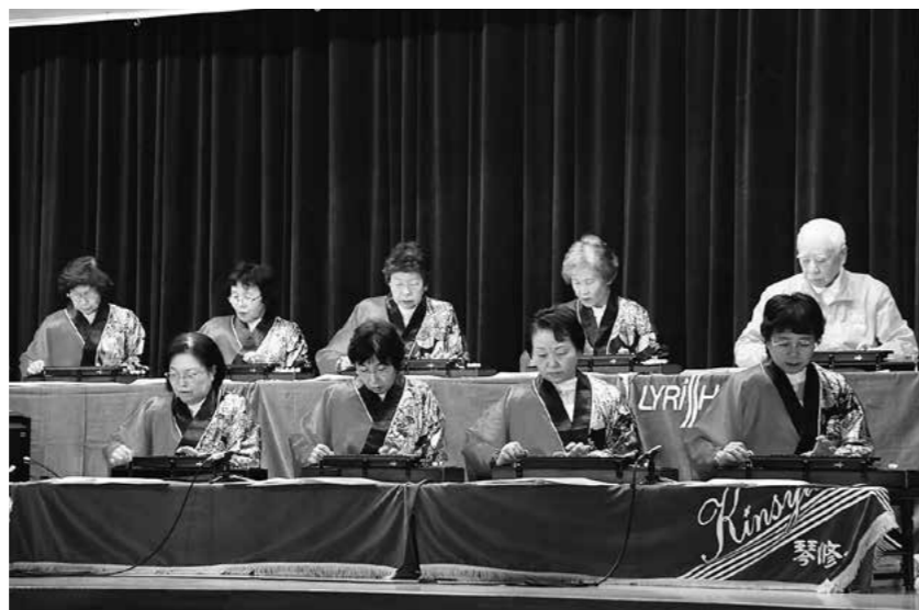
↑琴修会による大正琴の音色に聞き入りました