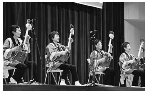
↑畑谷芸能愛好会によるスコップ三味線