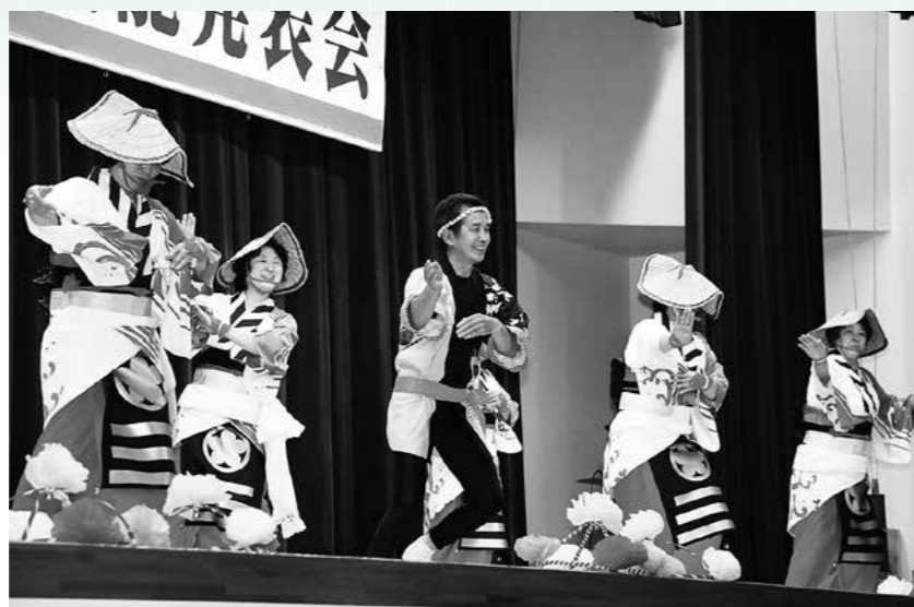
↑色鮮やかな衣装をまとった茂浦民謡同好会