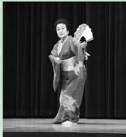
↑「花は咲く」に合わせた踊りを披露