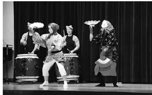
↑「ひよつとこ」と「おかめ」のひょうきんな動きに会場は笑いの渦に