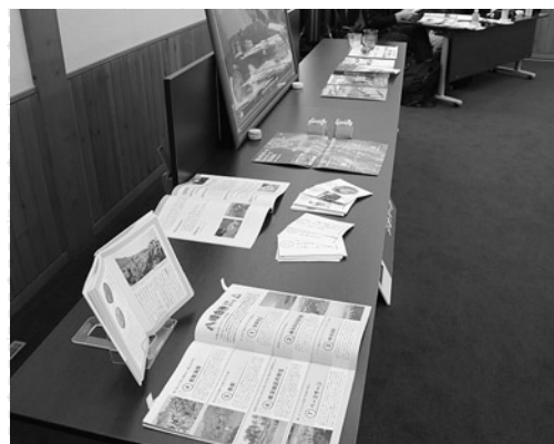
総会ではジオパーク関連資料も紹介しました