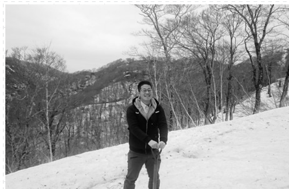
残雪の二ツ森登山口へ

八峰白神ジオパーク推進協議会事務局 〒018-2632 秋田県山本郡八峰町八森字三十釜一四四一 ぶなっこランド内 TEL 0185-177-3086