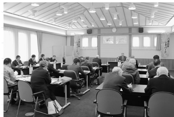
平成28年度総会の様子

こんにちは。八峰白神ジオパーク推進協議会事務局です。先日、平成28年度八峰白神ジオパーク推進協議会の総会が開かれ、今年度の事業案、予算案についてご承認を頂きました。