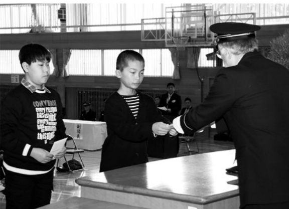
少年警火団記念品授与