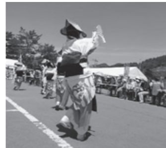
国境400年まつりの様子です

会場は国境近くの八タハタ館駐車場で、開催時間は9時30分から16時10分までの400分間。当日は八峰・深浦両町の関係者やエフエム秋田・エフエム青森のパーソナリティ、秋田・青森両県のお笑い芸人や郷土芸能関係者などが登場しました。なかでも面白かったのが、