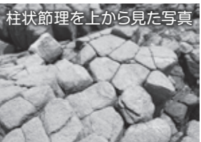
柱状節理を上から見た写真

それは、「溶岩が冷えると縮む性質」に関係します。柱状節理は、上から見ると六角形や八角形などになっています。溶岩が冷える時、内部の温度と表面の温度が違ふことで、全ての場所でいっせいに縮もうとします。等間隔に並んだ中心に縮もうとすると六角形などの亀裂が生じるのです。…と言われても少し難しいですね。下の4コマで簡単に説明していますのでご覧ください。