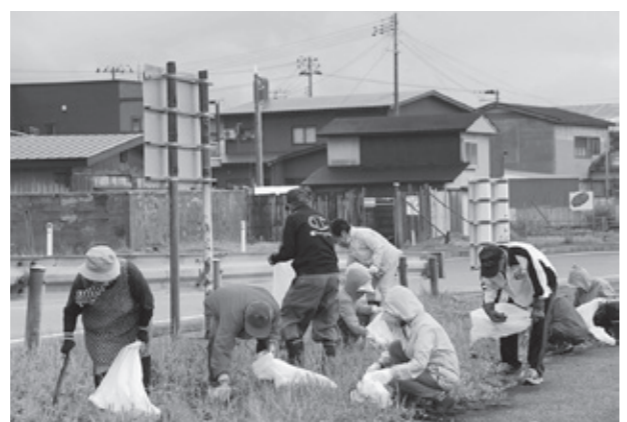
クリーンアップに汗を流しました

7月13日、八森地区の海岸でクリーンアップが行われました。海水浴シーズンを前に海岸をきれいにし、訪れた方々に気持ちよく利用してもらおうと、毎年実施しています。この日は悪天候の中でしたが、朝7時から自治会ごとに多くの方々が集まり、最寄りの海岸でゴミを拾いました。集まった町民の皆さんは、広い海岸や海岸付近の草むらにそれぞれ散らばり、缶やビン、プラスチック製品など多くのごみを集めていました。側溝や川にポイ捨てされたごみは、海へ流れ出し、やがて海岸へ漂着します。ごみのポイ捨ては絶対にやめましょう。