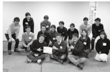
コミュニティづくりセミナーの集合写真

さて、私は今月末で協力隊を退任となります。長いようで短い3年間でした。いわゆる公共セクターで働くのは初めてで、1年の流れや予算の仕組みなど、様々なことを勉強することができました。今後には生かしていければと思います。退任後も町内にいますので、様々な機会にお目にかかるかと思えます。皆さま、3年間ありがとうございました。そして、今後ともよろしくお願いたします。