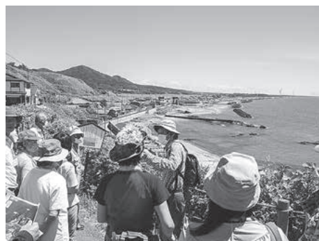
鹿の浦展望所で大地の活動の説明を聞きました。

また、午後からはフィールドワークを行いました。参加者の皆さんは、目の前に広がる景色がどんな風に見えるのか、その地形が暮らしにどんな影響を与えているのか、とても真剣に話を聞いていました。