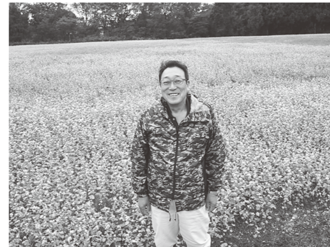
自慢のそば畑にて