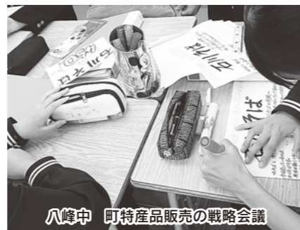
八峰中 町特産品販売の戦略会議