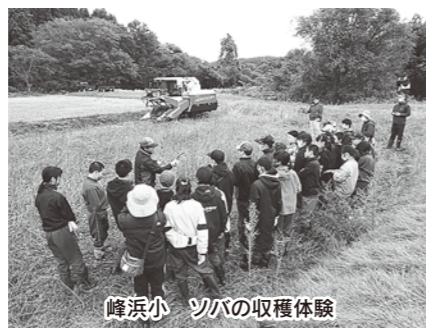
峰浜小 ソバの収穫体験