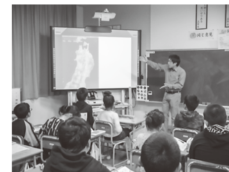
八峰町での出前授業の様子

八峰町は遊ぶ場所として非常にいい場所だということに気が付きまして、段々と私の遊び場になっていったんです。仕事場兼遊び場ですね。この間も実は妻と二人で遊びに行きました。八峰町の皆さんはとてもオープンなんですね。秋田の田舎ってそうとは限らないんですよ。そんな人々の魅力にも気づきはじめました。八峰町は鉱山があって昔から首都圏と交流がありますよね。そういう文化があるのは非常に感じます。八峰町の良さを語れる子どもがいれば、Uターンしてくることも考えられます。八峰町の魅力をもっと伝えていきたいですね。